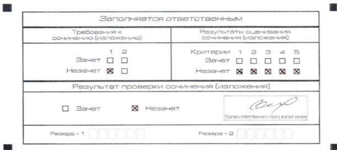
Рис. 7. Область для оценки работы

Эксперт комиссии (ответственное лицо, технический специалист 1 ) выставляет «незачет» за невыполнение требования № 2. В клетки по всем критериям оценивания выставляется «незачет». В поле «Результат проверки сочинения (изложения)» ставится «незачет».